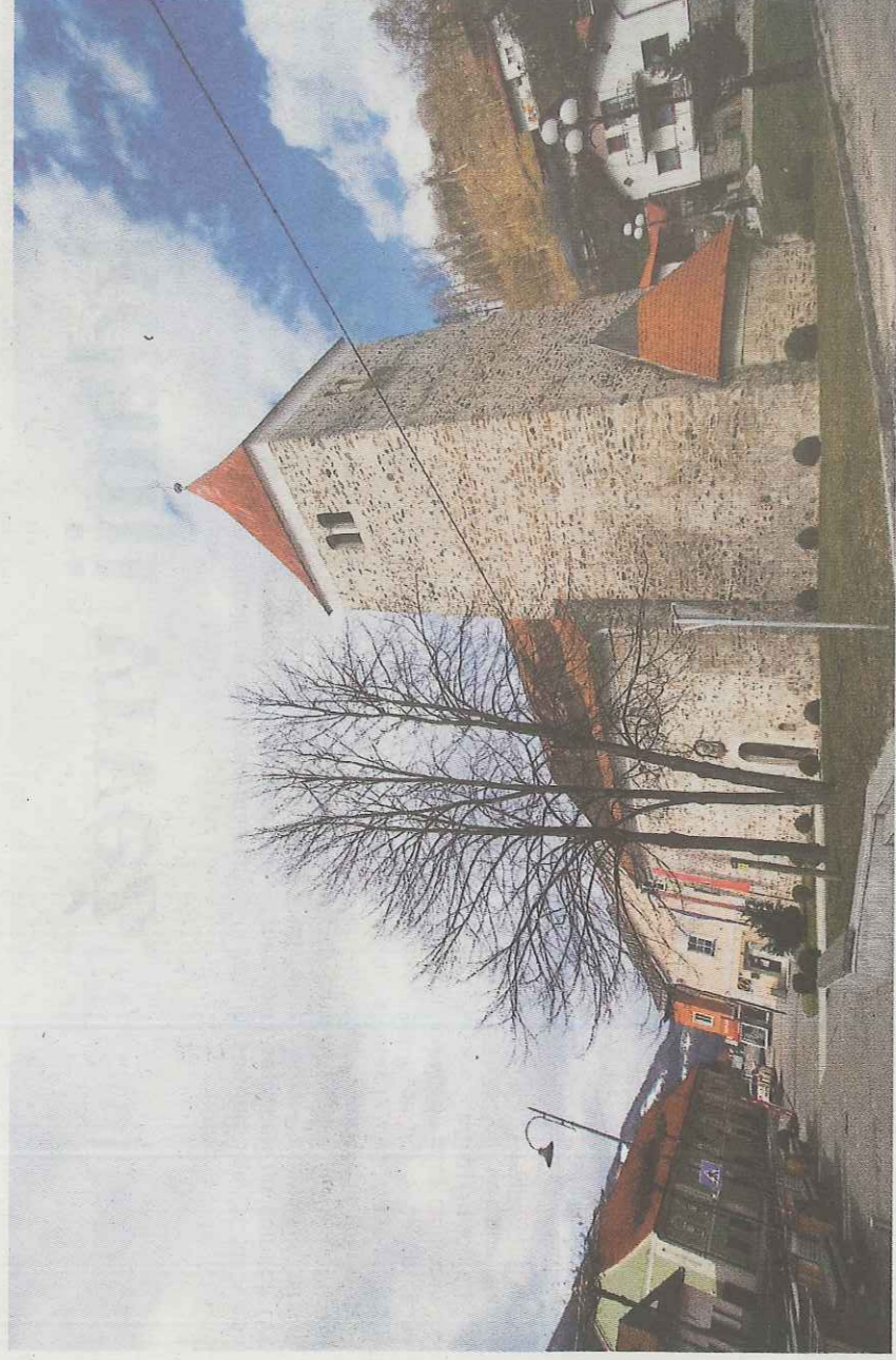
Ulice so bile prazne in osamljene...