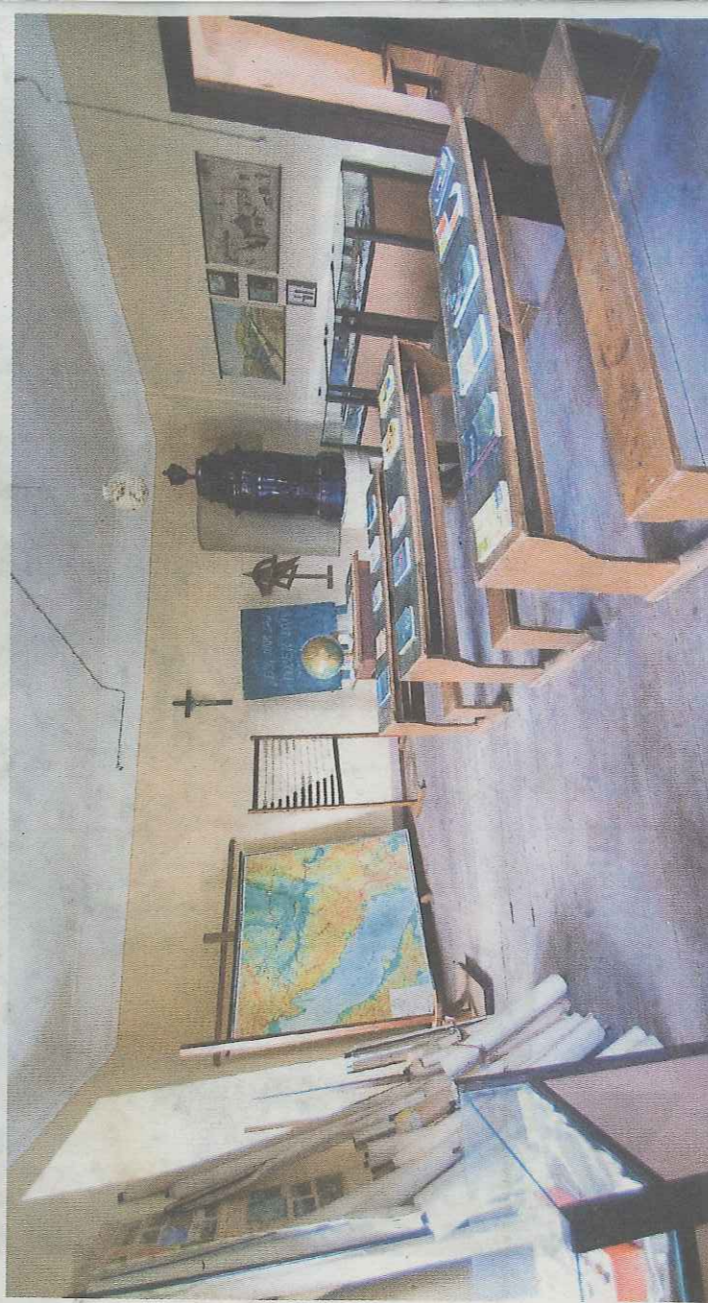
Stara šolska učilnica

Naj bo druženje vaših otrok z vrstniki varno, da boste tako kot kuža Pazi brezskrbno, nasmejano in po pameti korakali tudi v drugi polovici šolskega leta. Pričakujte nepričakovano in bodite brez skrbi! x