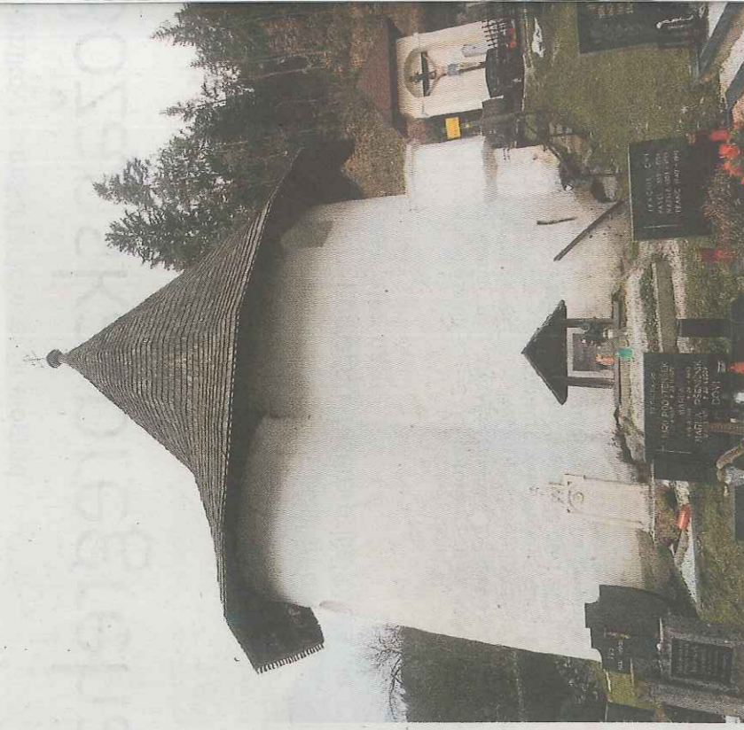
Kostnica v Libelčah