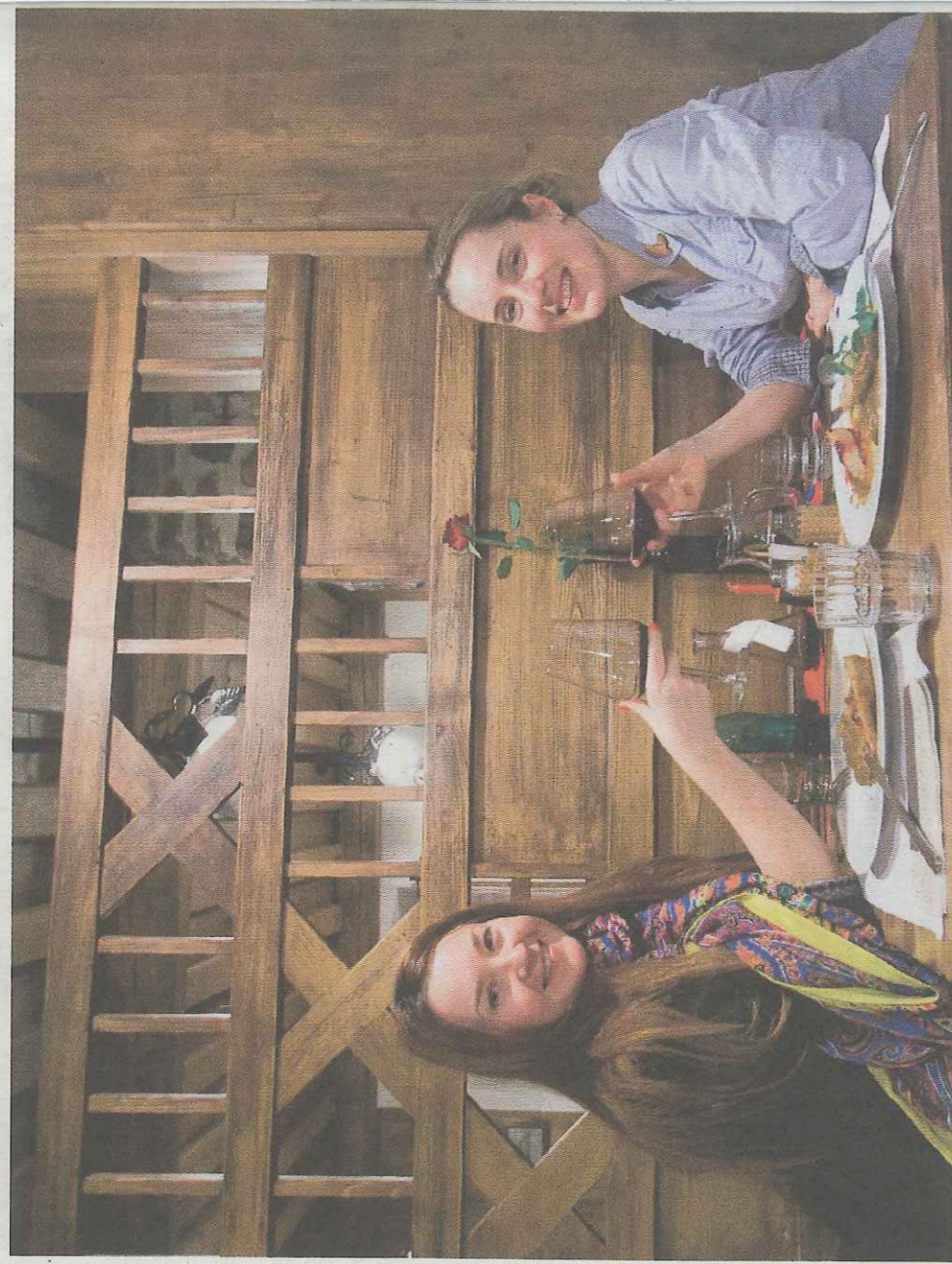
Nepozabna gurmanska izkušnja v Gostilni Pri lipi

»Zelo pozitivna izkušnja. Najprej sva na hitro preučili velik zemljevid, na katerega sva naleteli v neposredni bližini informacijske pisarne, nato sva se prepustili gostoljubju črnolase gospodične. Zelo je bila ustrežljiva, vzela si je čas za naju. Založila naju je s števil-