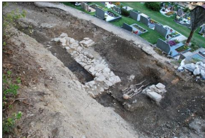
najdeni temelji in grob